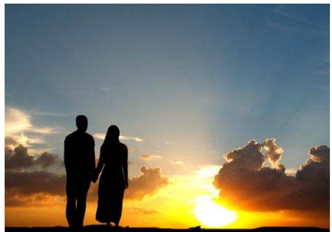
La intimidad del Shabbat

¿De qué sirve una habitación matrimonial si no tiene una novia? Todo lo que se creó en los primeros seis días fue preparado en nombre del Shabbat. Según este punto de vista, el Shabbat es más que una parte integral de la creación, es su objetivo.