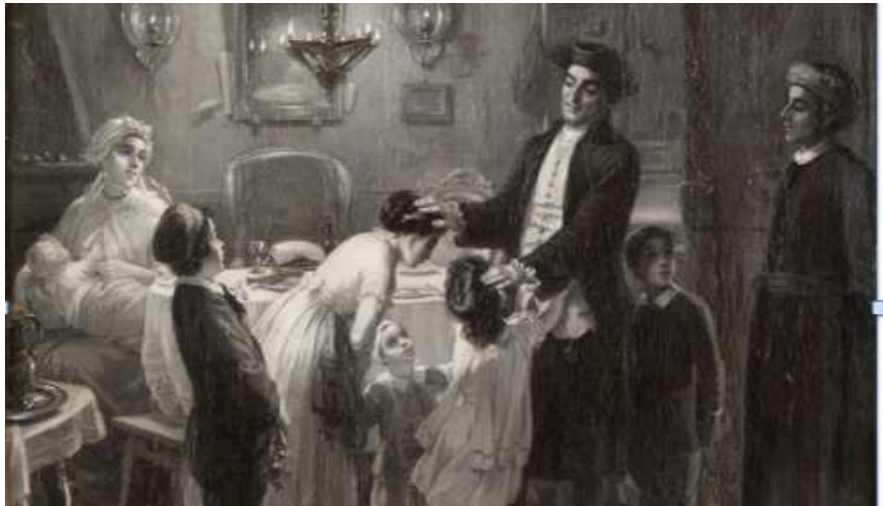
Bendiciones en la noche del Viernes de Moritz Oppenheim, 1867

Muchas representaciones artísticas del Shabbat destacan la cena familiar de Shabbat y sus rituales: la bienvenida de los ángeles en el himno de Shalom Aleichem , la bendición de los niños , el Kiddush , la canción Mujer de Valor , que elogia al mismo tiempo al Shabbat, la Shejnah Divina , y a la mujer en el hogar que tradicionalmente prepara las delicias del Shabbat . Por tanto, mientras Heschel nos enseña que el Shabbat es una catedral en el tiempo, nuestra experiencia de vida es que Shabbat también es un santuario íntimo en el seno familiar.