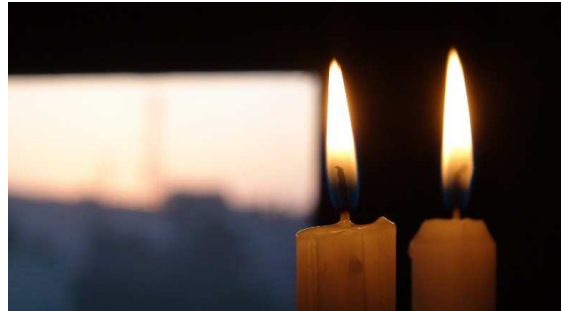
Las luces del Shabbat

Muchas personas consideran equivocadamente que la creación del hombre en el sexto día, fue el momento cumbre de la creación. Pero una lectura más minuciosa de la Tora muestra que el mayor logro de la creación es en realidad el Shabbat.